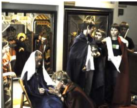
Fotografia ilustruje „żywy obraz” stworzony przez młodzież podczas warsztatów muzealnych. Ukazuje scenę „Pokłonu trzech króli” przygotowaną na podstawie „Poliptyku Augustiańskiego” autorstwa Mikołaja Haberschracka, eksponowanego w Pałacu Biskupa Erazma Ciołka.

(Z uwagi na specyfikę warsztatu prosimy o przybycie w luźnych strojach.)